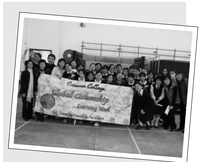
嘉諾撒書院的師生萬眾一心，舉辦了一個有聲有色，全校參與的「世界公民教育周」

樂施會「世界公民教育周」的其中一間伙伴學校嘉諾撒書院，便在校內舉行了為期四個月的全校參與式世界公民教育活動。由於樂施會得到利希慎基金的資助，得以在嘉諾撒書院推行配合的深化學習活動，能在校內的「世界公民教育周」前，為十數位中二至中六的學生領袖，提供了兩個月的「扶貧領袖訓練」，培養領袖同學帶動全校關注世界公義的精神與能力，為籌組活動作出準備。整個活動非常成功，其經驗必能為有意在學校舉行同類型活動的老師，提供全面而實質的參考。