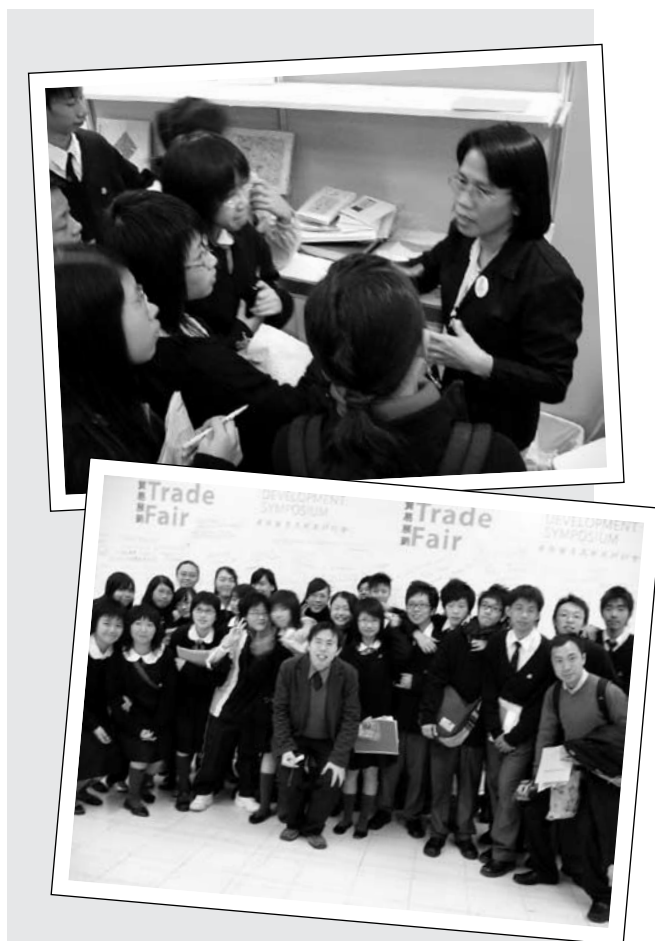
樂施會與保良局李城璧中學的兩位老師與一班中四級的綜合人文科同學，一同到「公平貿易墟」訪問發展中地區的農民及農民組織，了解現行的國際貿易政策對發展中地區人民生計的影響

活動進行期間，正值香港舉行「世界貿易組織第六次部長級會議」，政府及多個團體均舉辦有關貿易的活動，為同學提供了實地考察的機會。其中，同學便參加了由國際樂施會主辦的「公平貿易墟」這個與貿易有關的實地學習活動，讓同學在課堂活動外，也有機會親身接觸發展中地區農民，探究不公平的國際貿易規則對人民生計的影響，直接感受到世界各地的相互依存關係，反思個人對世界的責任。